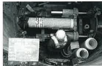
施工状況 (北広島市)